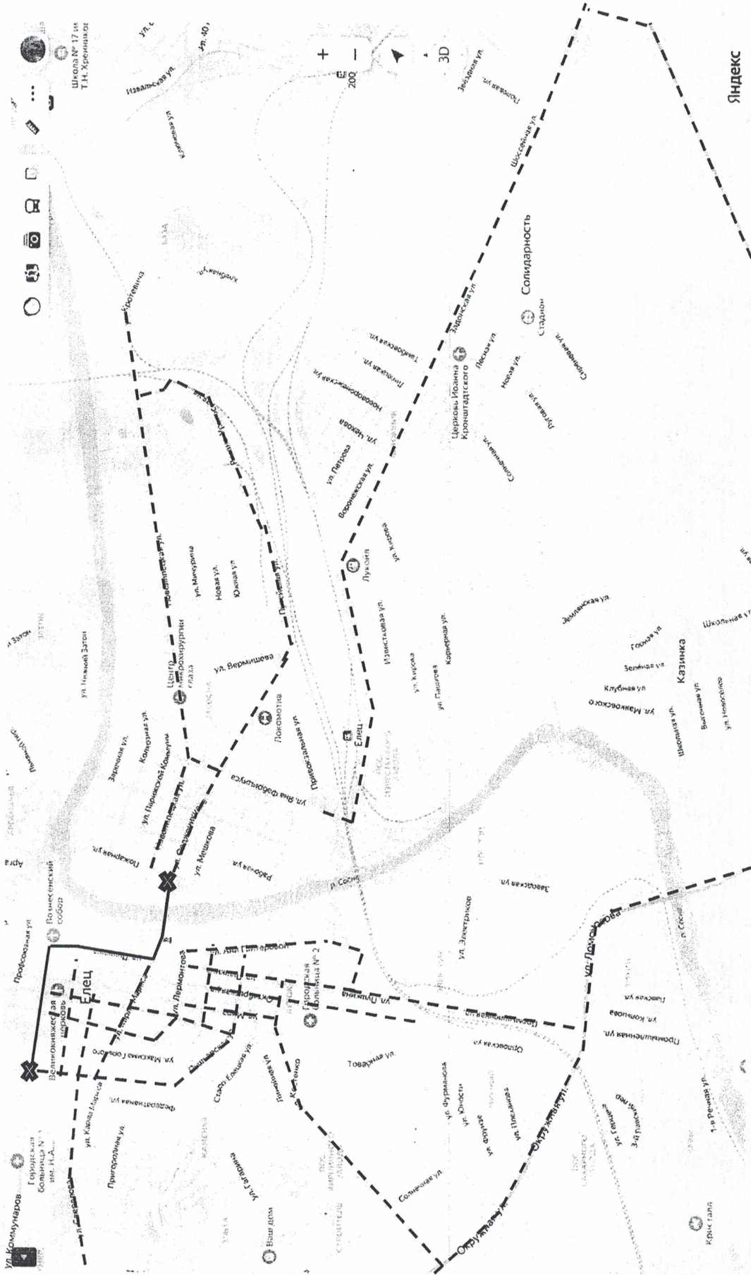
Схема временной объездной дороги

----- Возможна схема объезда — Зона перекрытия