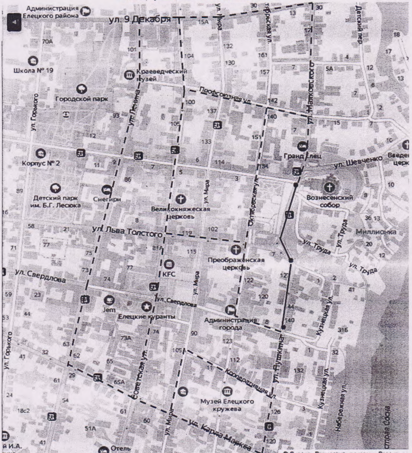
Схема временной объездной дороги

----- Возможная схема объезда ———— Зона перекрытия