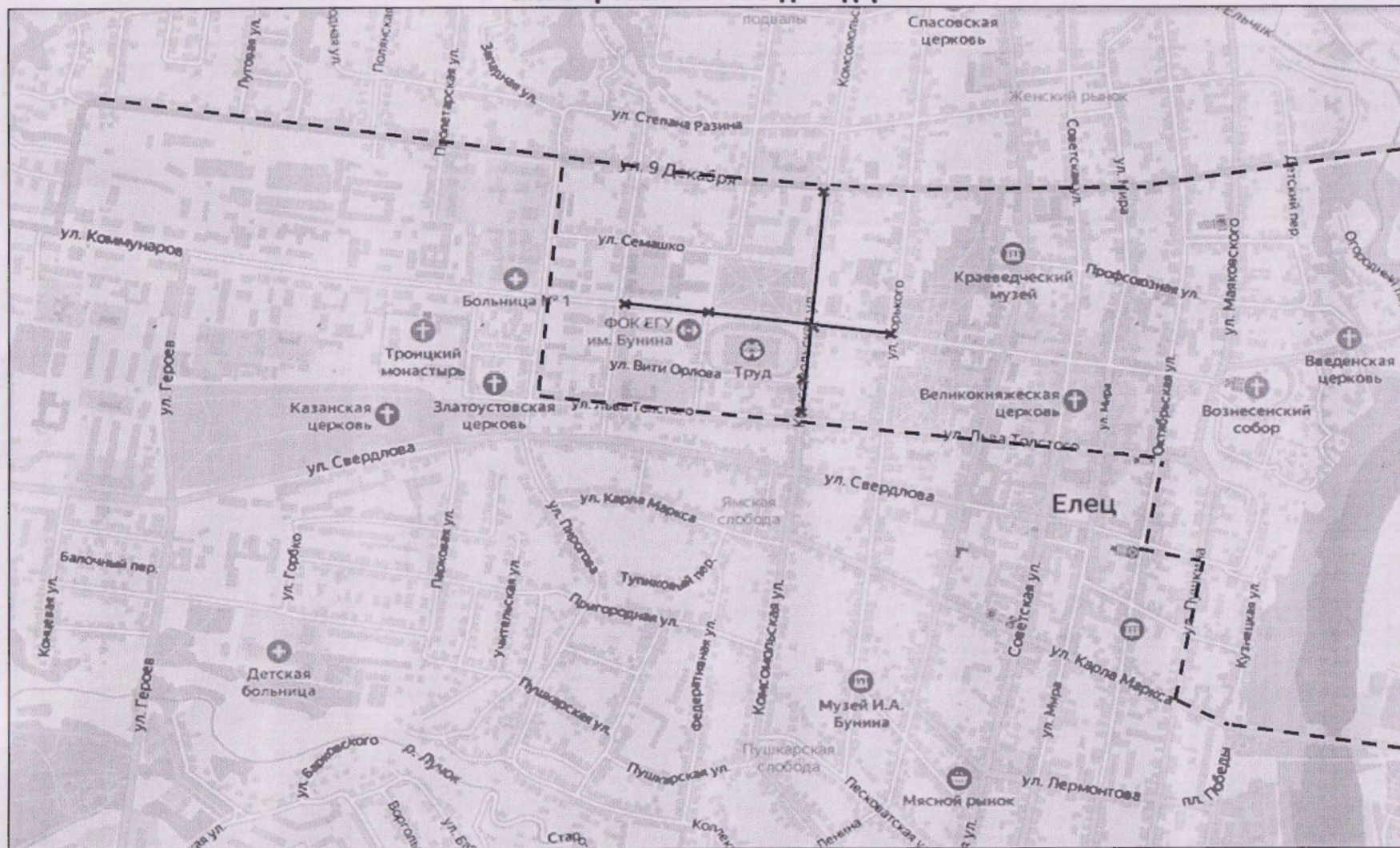
Схема временной объездной дороги

----- Возможная схема объезда —— Зона перекрытия