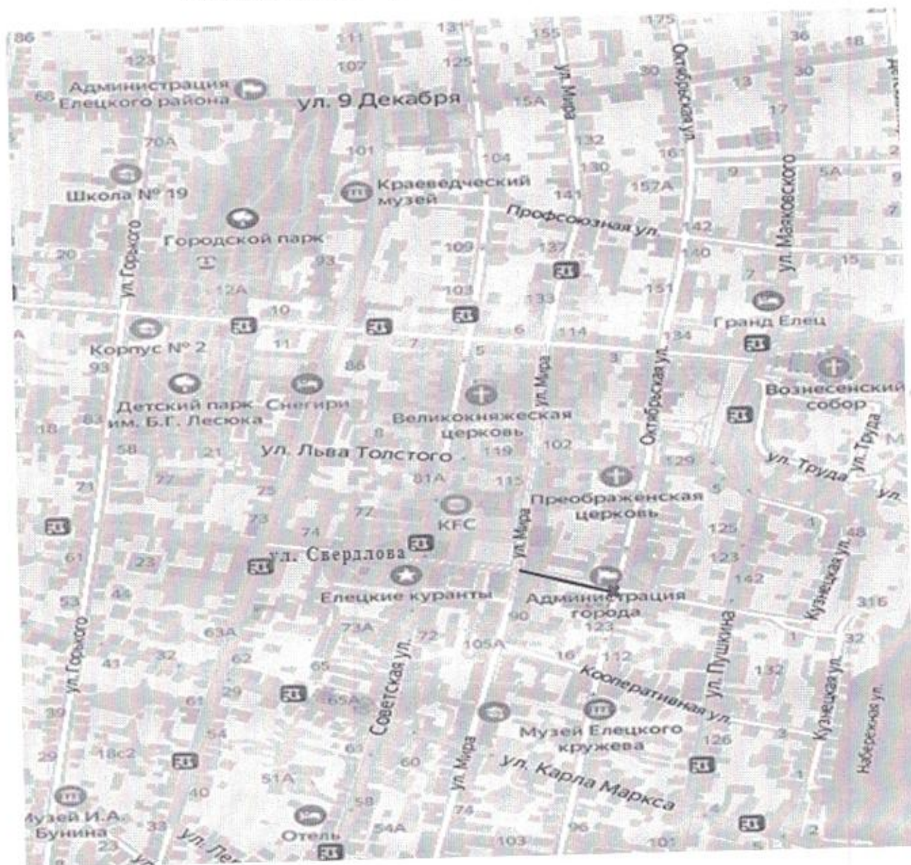
Схема прекращения движения транспортных средств

..... Возможная схема объезда ———— Зона перекрытия