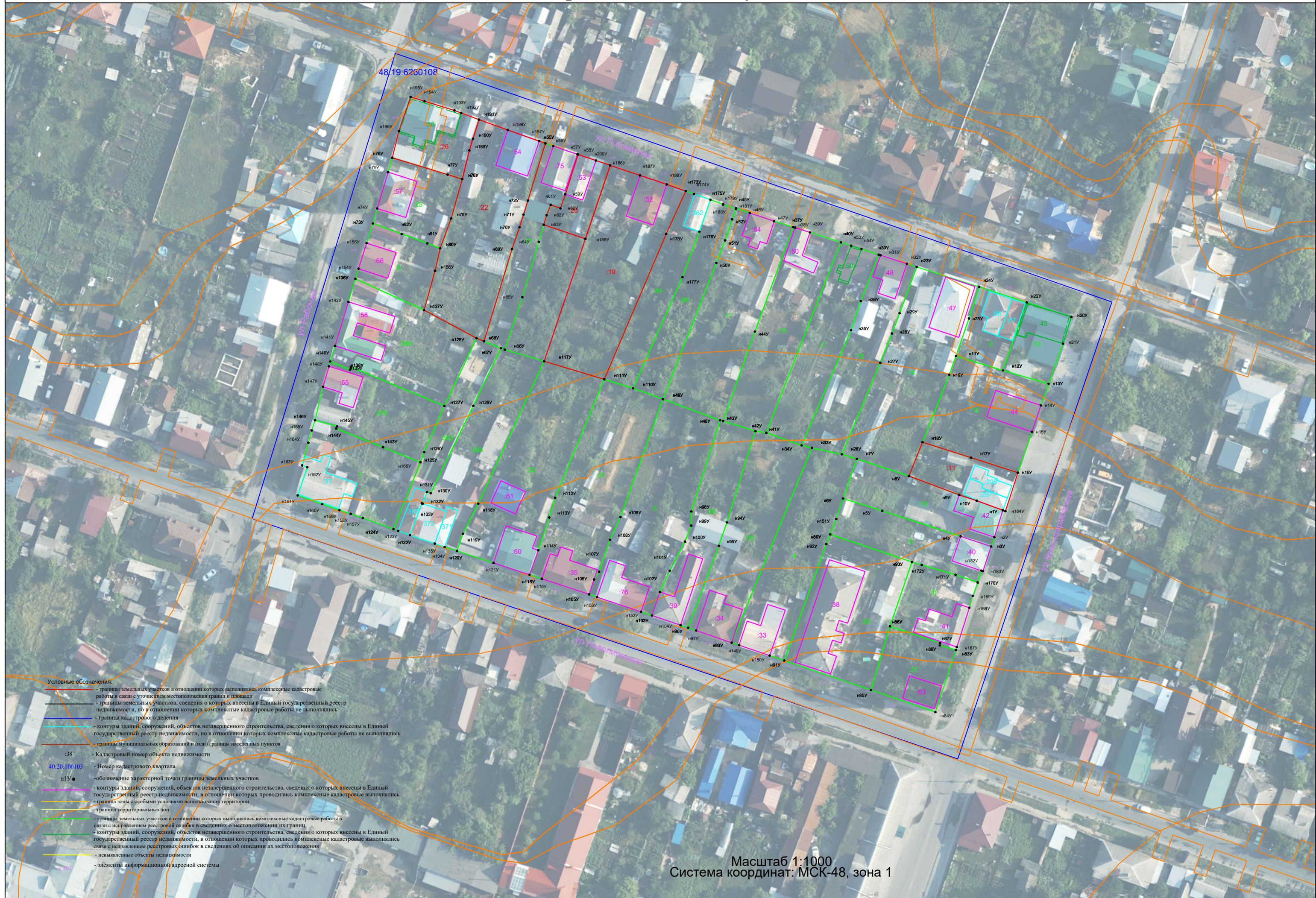
Схема границ земельных участков